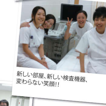
新しい部屋、新しい検査機器、 変わらない笑顔!!