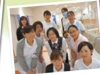
(患者さんにとって) 玄関近くなってよかった!