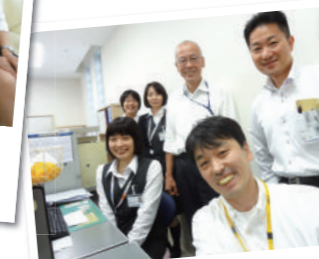
新しくなって「気持ちイイ〜!」