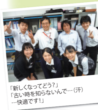
「新しくなってどう?」 「古い時を知らないんで…(汗) …快適です!」