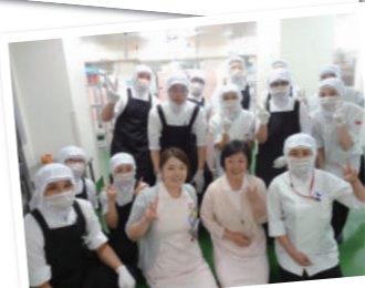
これからも心をこめた食事をお届けします!