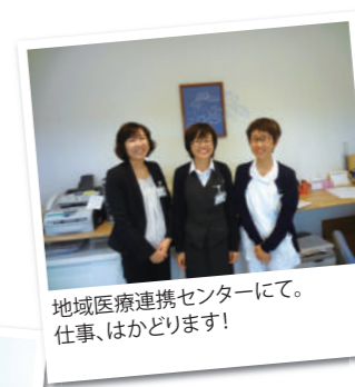
地域医療連携センターにて。 仕事、はかどります!