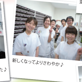
新しくなってよりさわやか♪