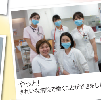
やっと! きれいな病院で働くことができました♪