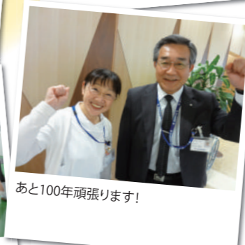
あと100年頑張ります!