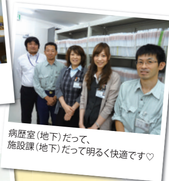
病歴室(地下)だって、 施設課(地下)だって明るく快適です♡