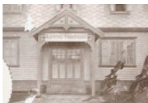
木造2階建ての洋館 25床。主に内科診療。