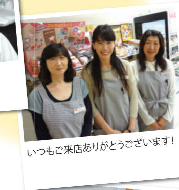
いつもご来店ありがとうございます!