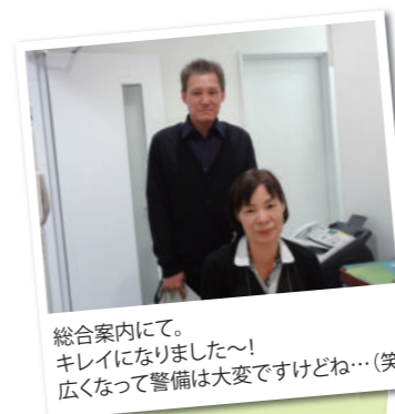
総合案内にて。 キレイになりました〜! 広がって警備は大変ですけどね…(笑)