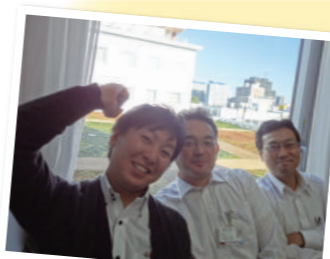
グランドオープン、やったー!!