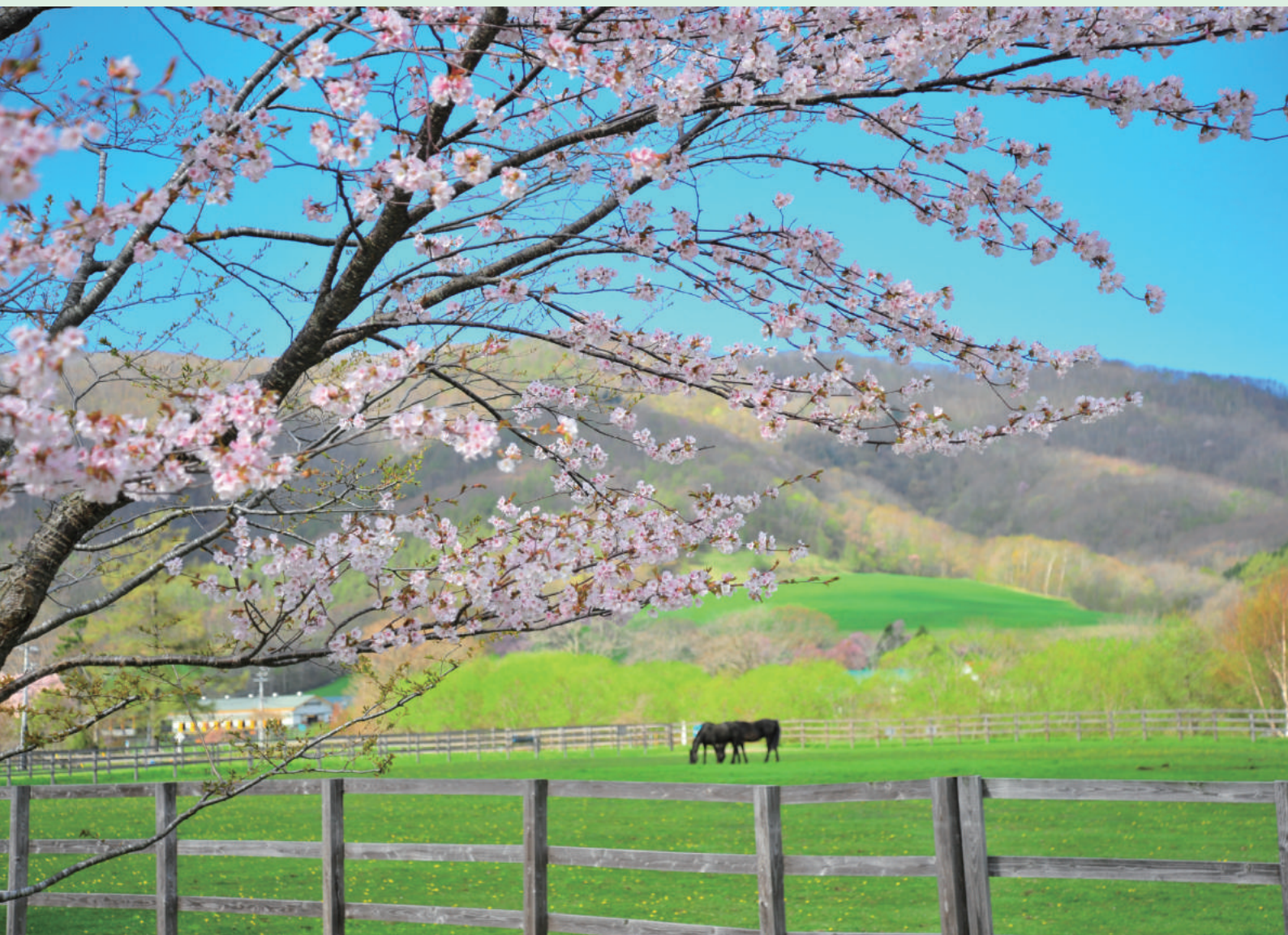
タイトル:「お馬さんの春」