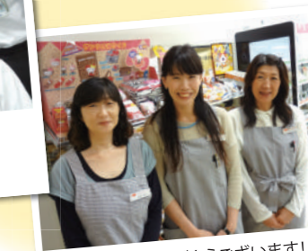
いつもご来店ありがとうございます!