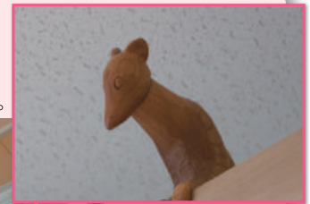
◎クロテン 大きく身を乗り出して、 今にも飛び出しそうです。