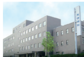
東棟を増築 東棟地下1階、地上4階建。 翌年NICUが認可。