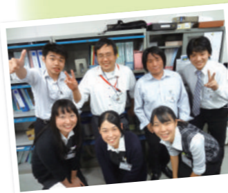
「新しくなってどう?」 「古い時を知らないんで…(汗) …快適です!」