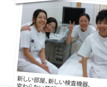
新しい部屋、新しい検査機器、 変わらない笑顔!!