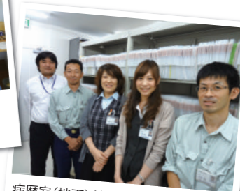
病歴室(地下)だって、 施設課(地下)だって明るく快適です♡