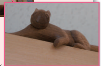
◎エゾリス 木の上に張りついて のんびり下を眺めています。