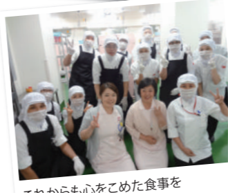
これからも心をこめた食事をお届けします!