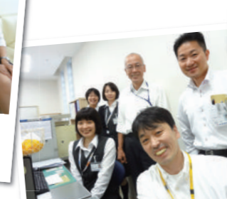
新しくなって「気持ちイイ〜!」