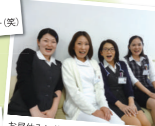
お昼休みに休憩室を直撃。 しっかり休んでしっかり働きますよ♪