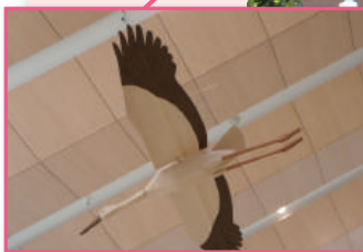
◎コウノトリ 羽を大きくはためかせ 気持ちよく飛んでいるよう。