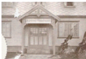
木造2階建ての洋館 25床。主に内科診療。