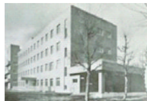
鉄筋コンクリート建て 本館地下1階、地上4階建。 年間分娩数が日本一に。