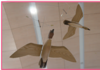
◎コガモ 2羽仲良く飛んでいます。

1972年 旭川で木工芸を始める 1977年 個展活動 1984年 東川町に工房を移転 1991年 実物大鳥モビール「鳥たちの空」展開 2001年 壁面アート製作