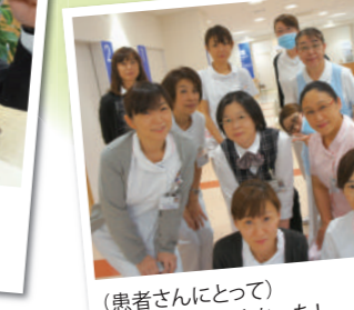
(患者さんにとって) 玄関近くなってよかった!