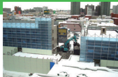
全面新築工事開始 まだまだ雪の多い2月に解体工事が始まる。