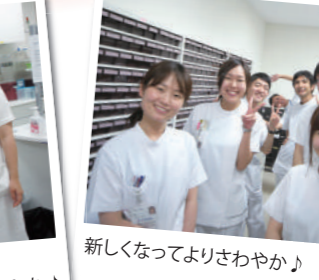
新しくなってよりさわやか♪