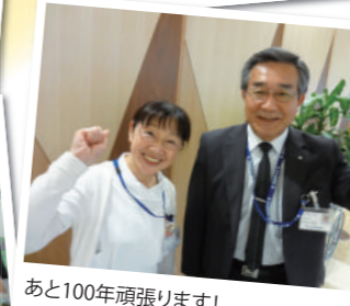
あと100年頑張ります!