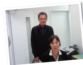
総合案内にて。 キレイになりました〜! 広がって警備は大変ですけどね…(笑)