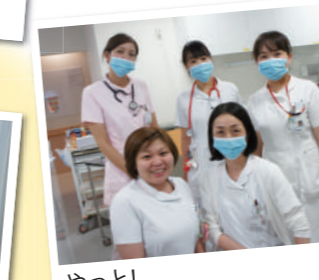
やっと! きれいな病院で働くことができました♪