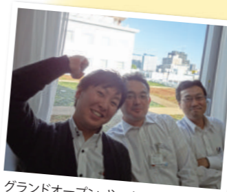
グランドオープン、やったー!!