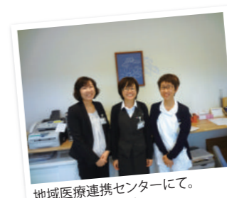
地域医療連携センターにて。 仕事、はかどります!