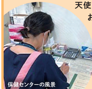
保健センターの風景