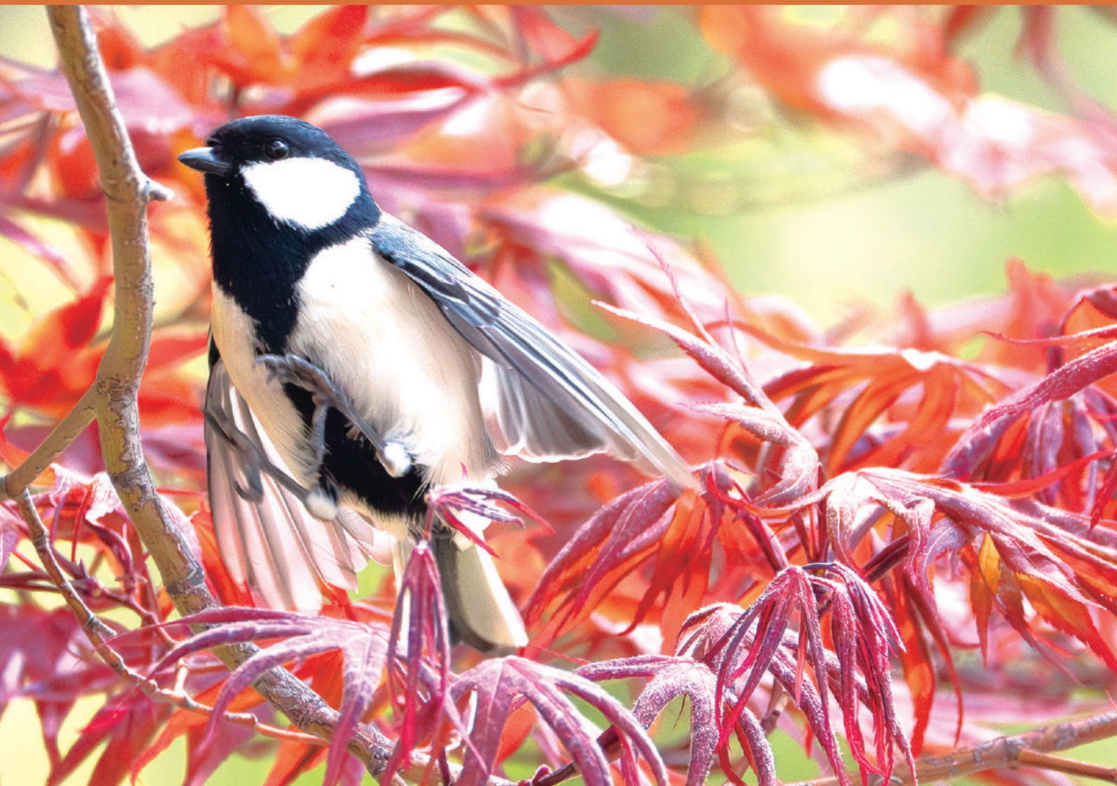
タイトル：四十雀