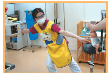
はい、動かないでね〜。