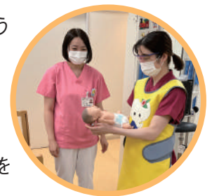
NICUで借りてきた“この子”で撮影風景を再現します。

この撮影台を使用する際は、2人の技師で前後から支え、安全に配慮しながら撮影を行うのが基本です。付き添いの方には、撮影室の外から撮影の様子を見ていただくので、放射線の影響もなく安心してお子さんを見守っていただけます。当院の技師は小児の撮影経験が豊富ですので画像の質は高く、再撮影になることも少ないようです。また、小児に限らず、一般撮影やCTのX線被ばく低減にも、日々取り組んでいます。小さなお子さんの検査には不安もあると思いますが、技師一同、常に安全に検査を受けていただけるように気を配っていますので、どうぞご安心ください。