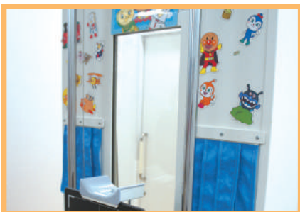
乳幼児専用の撮影台です。 キャラクターでデコレーションしてやわらかい雰囲気。